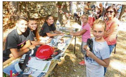
Les jeunes pompiers sont venus à la rencontre du public. De nombreuses activités étaient proposées à tous.